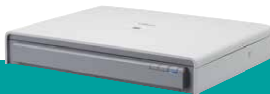
Optionele A3 Flatbed Scanner Unit 201