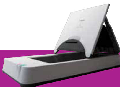
A4 Flatbed Scanner Unit 101

Breid uw scanner uit met de optionele Flatbed Scanner Unit 101 voor documenten tot A4, of Flatbed Scanner Unit 201 voor A3, zodat u ook ingebonden en kwetsbare documenten moeiteloos kunt scannen. De flatbedscanners worden aangesloten via USB en werken naadloos samen met de DR-G1130 en DR-G1100, zodat u in één handeling vanuit twee scanbronnen kunt scannen en op iedere scan dezelfde functies voor beeldverbetering kunt toepassen.