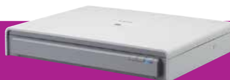
A3 Flatbed Scanner Unit 201