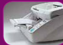
Hoogste stand (100 vel)

De documentinvoer heeft drie invoermodi (voor 100, 300 en 500 vel), die worden ingesteld op basis van het documentvolume dat wordt gescand. Dit bespaart de gebruiker tijd en verhoogt de doorvoer.