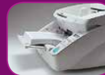
Middelste stand (300 vel)