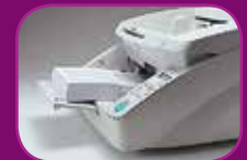
Laagste stand (500 vel)